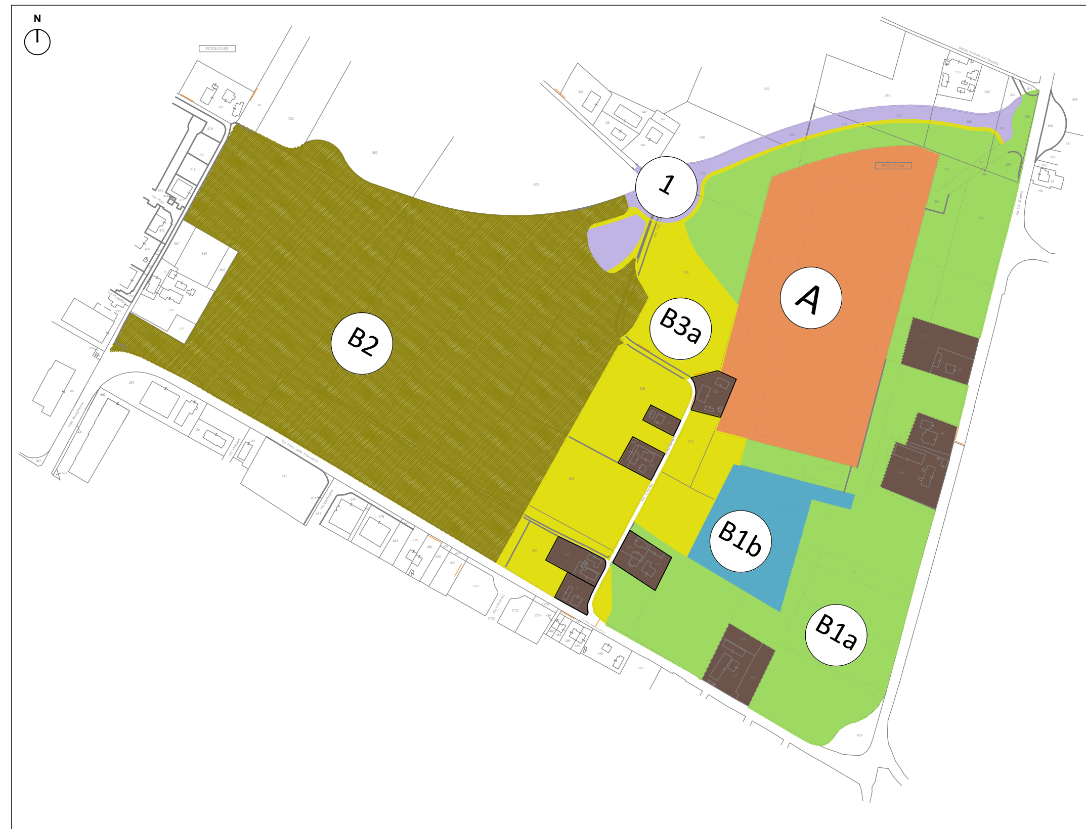
Scheda PRG 174 "Area Colombarina" Stralci funzionali autonomi e blocchi realizzativi all'interno dei Sub Comparti B1 (B1a e B1b) e B3 (1 e B3a )